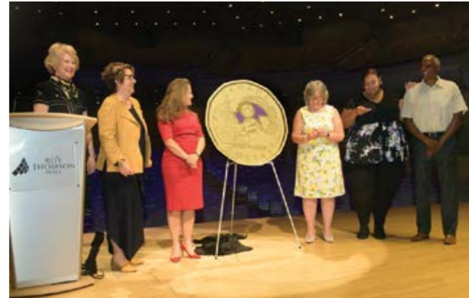
En 2022, la Monnaie a rendu hommage à Oscar Peterson, le premier musicien et Canadien noir à figurer sur une pièce de circulation. La famille de M. Peterson était présente au dévoilement de la pièce commémorative de 1 $ au Roy Thomson Hall à Toronto.

Avoir une influence positive sur les vies de nos employés, sur les collectivités dans lesquelles nous travaillons et sur le Canada en général est l'un des piliers de notre engagement envers les facteurs ESG.