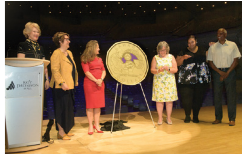
En 2022, la Monnaie a rendu hommage à Oscar Peterson, le premier musicien et Canadien noir à figurer sur une pièce de circulation. La famille de M. Peterson était présente au dévoilement de la pièce commémorative de 1 $ au Roy Thomson Hall à Toronto.

Avoir une influence positive sur les vies de nos employés, sur les collectivités dans lesquelles nous travaillons et sur le Canada en général est l'un des piliers de notre engagement envers les facteurs ESG.